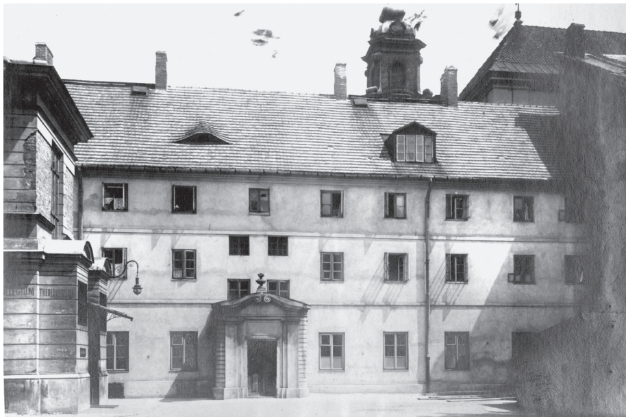
4. Konwikt Teologiczny od dziedzińca Gimnazjum św. Stanisława