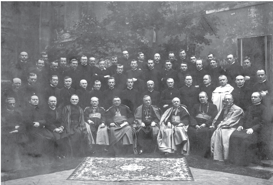
10. Zjazd biskupów.