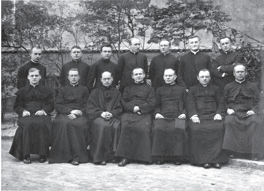
12. Zarząd konwiktu wraz z konwiktorami.