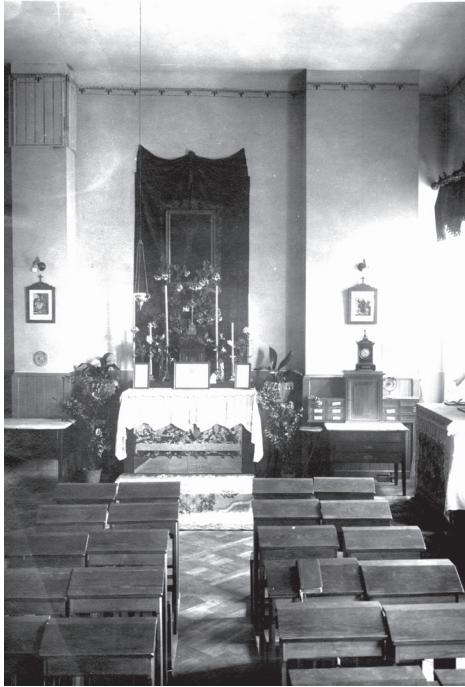
Z lewej strony: 7. Kaplica Konwiktu Teologicznego