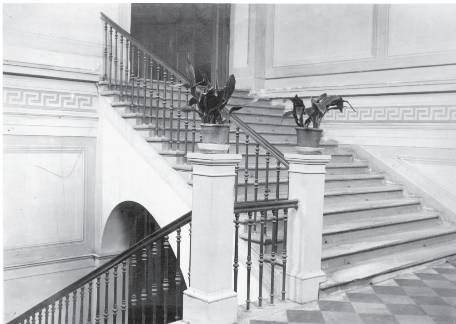
6. Klatka schodowa Konwiktu Teologicznego