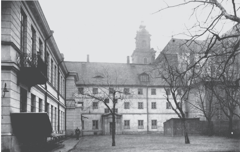
3. Oficyna Konwiktu Teologicznego – mieszkania konwiktatorów od strony zachodniej