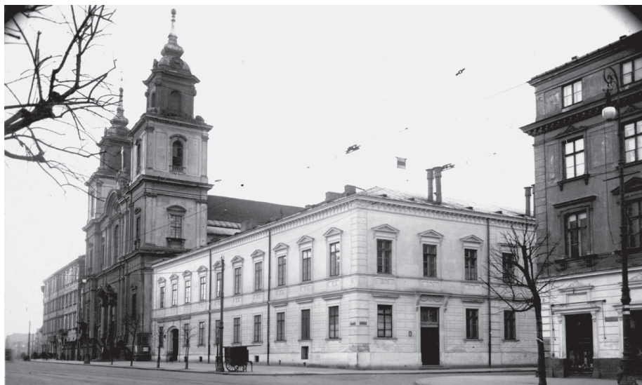
1. Konwikt teologiczny od ulicy Krakowskiego Przedmieścia