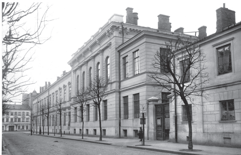
2. Konwikt Teologiczny od ulicy Traugutta