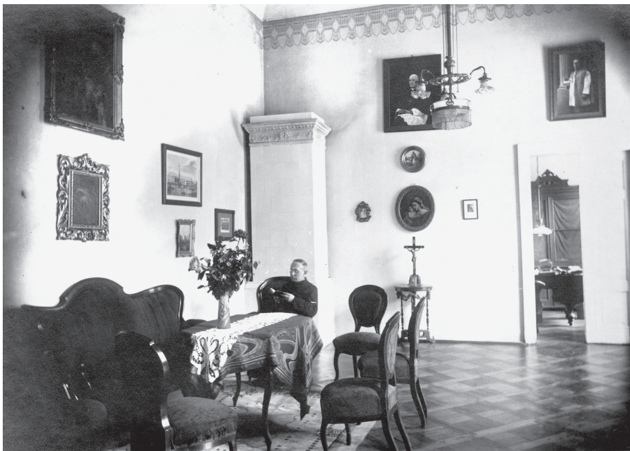
Poniżej: 8. Salon Księdza Rektora