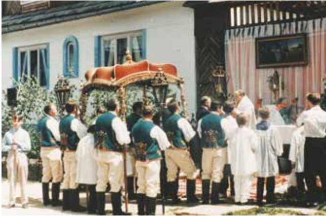
1. Procesja Bożego Ciała w Kacwinie