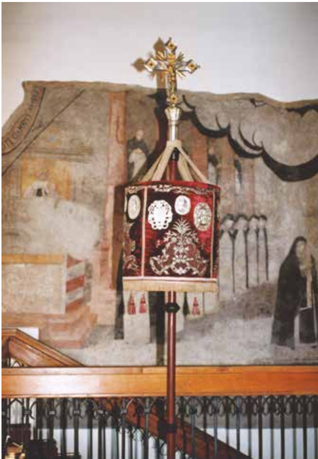
2. Baldachim w typie umbelli, XVII w., Muzeum w Raciborzu