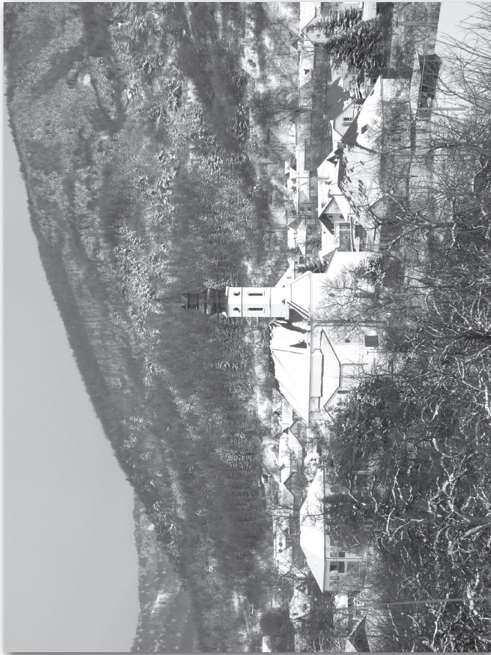
Lutinská bazilika minor v zime roku 2009.